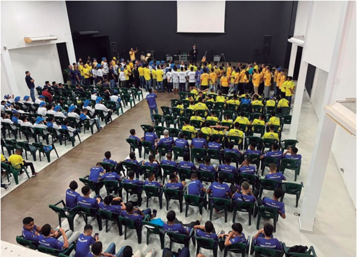
ERER NE 6