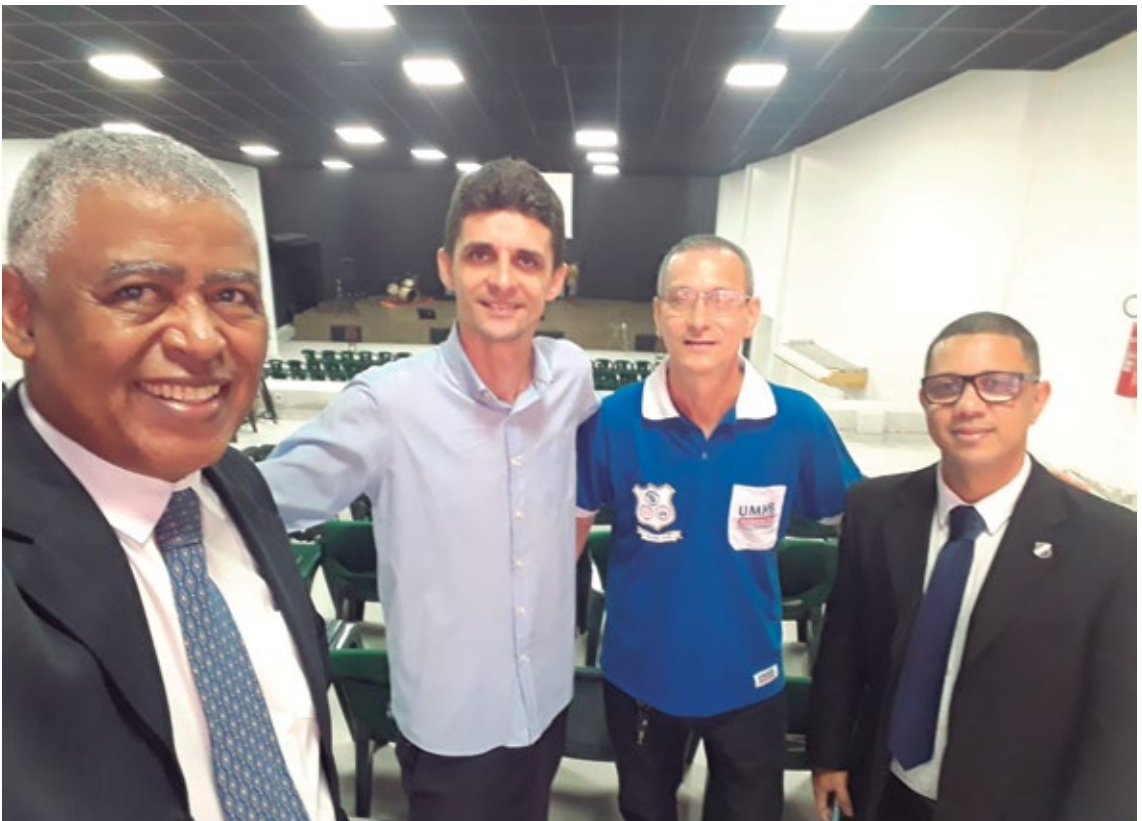
ERER NE 10