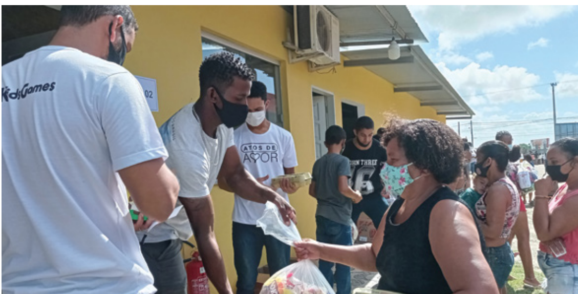
Ação Social Atos de Amor, patrocinado pelos homens batistas capixabas, na cidade de São Mateus, ES.