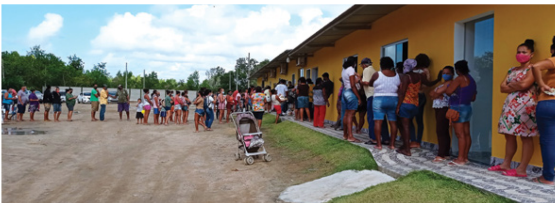
Atendimento espiritual, psicológico e distribuição de cestas básicas à população carente no norte do Espírito Santo, pela pelos homens batistas.