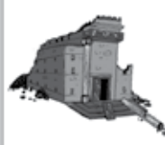
Templo em ruínas depois da destruição