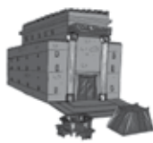
Templo de Salomão