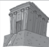
Reconstrução do templo